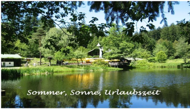
Sommer, Sonne, Urlaubszeit